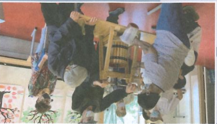
VISITE DU PRESSOIR À LA DAMASSINE